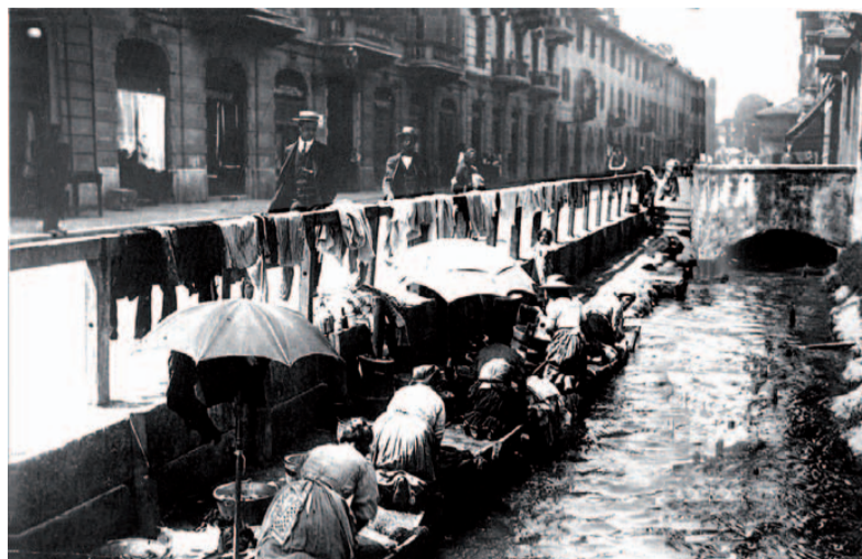
La Vettabbia di via Anfossi, ieri e oggi

- L'acqua con i corsi d'acqua Vettabbia, Lambro, Redefossi e alcuni cenni al Porto di Mare.