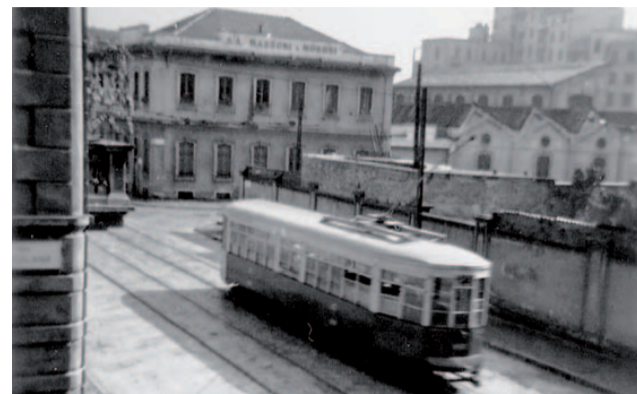
Il 23 in via Bergamo

Citiamo poi il 23, che già da parecchi anni congiungeva piazzale Susa con viale Umbria (all'angolo con via Angelo Maj): il per-