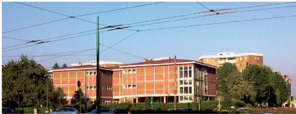
La scuola di viale Puglie

dente della commissione educazione di zona, dagli uffici zonal, da quanti erano interessati ad una soluzione positiva del problema, ha portato a dei risultati che possono soddisfare, ad oggi, la maggior parte dei diretti interessati: genitori, docenti di entrambe le scuole, dirigenti scolastici. Lo stesso Consiglio di Zona, nella sua ultima riunione del