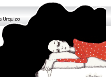
Disegno di Marcia Zegarra Urquiza

affettivo creato dalla decisione del figlio di sposare e di avere poi un figlio dalla donna con la quale conviveva ("una persona insignificante per la madre, lui così bello e intelligente meritava di più"). Dal sogno emerge il timore di essere sostituita affettivamente, con il matrimonio, da un'altra donna. Dapprima incredula, poco alla volta la comprensione del sogno le ha lasciato tanta pace, perché ha compreso che il ruolo della madre è quello di restare