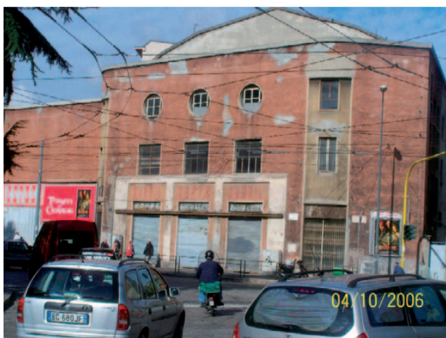
Il cinema Maestoso, ancora aperto, in una foto del 2006