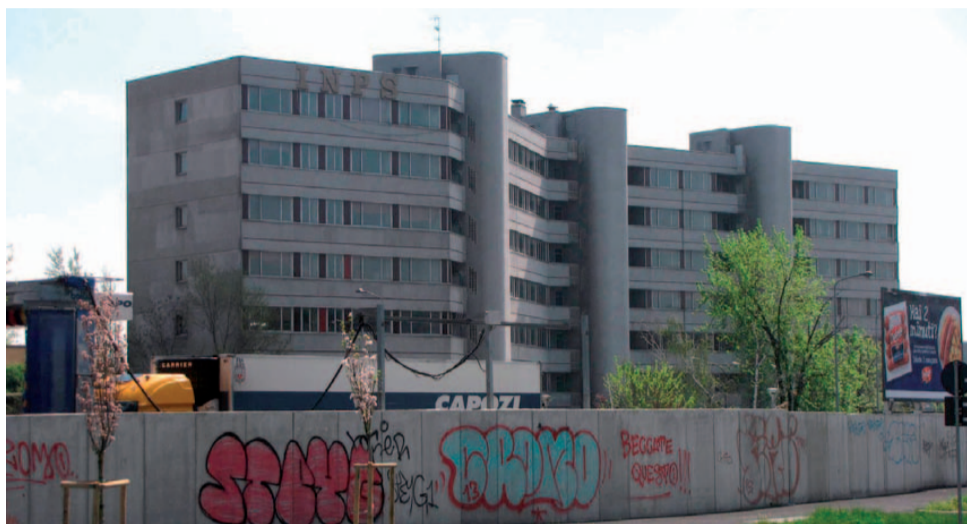
Il palazzo ex-Inps in via Toffetti

Per Santa Giulia , area più volte oggetto di attenzione nazionale, l'assessore conferma che l'area immediatamente a ridosso della stazione Rogoredo è stata dissequestrata, e a breve dovrebbero riprendere i lavori per l'estensione della sede Sky e il nuovo NH Hotel, mentre per la grande area nord tutto è ancora bloccato dal tribunale e il progetto presentato qualche me-