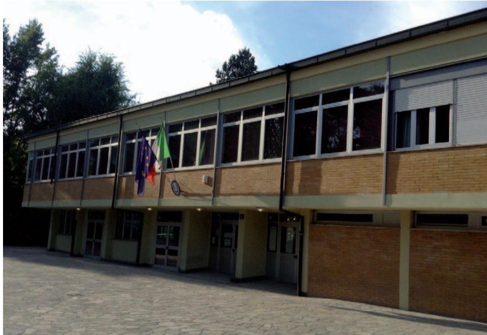
L'ingresso della scuola di via Oglio 20

«Chi vuole rimanere nel centro deve rispettare le leggi. Questa è la prima condizione. Noi possiamo fare da consulenti nella loro ricerca di un lavoro - aiutandoli a scrivere un curriculum o dando loro un indirizzo, ma il nostro aiuto non può che fermarsi qui. Il resto