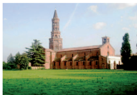
L'Abbazia di Chiaravalle

La Vettabbia (dal latino vectabilis che significa trasportabile o capace di trasportare). Fu un canale navigabile, alimentato a nord dalle acque del Seveso, costruito dai Romani subito dopo la conquista di Milano (Mediolanum) nel 222 a.C. da parte del console