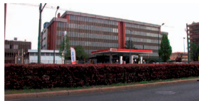
Il palazzo ex-Telecom in via Mecenate

di comunicazioni ufficiali a tutti i proprietari privati delle aree per invitarli alla messa in sicurezza e alla messa in atto di azioni per il loro recupero. L'assessore ha confermato che la risposta a queste comunicazioni è stata ampia e positiva e alcuni edifici hanno già subito una prima messa in sicurezza. Inoltre, notizia poi confermata a metà luglio, è in atto la modifica del Regolamento Edilizio Comunale; infatti l'attuale risale al 1999 quando, per esempio, ancora