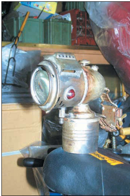
Fanale di bicicletta dei primi del 900