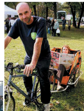
QUATTRO arriva in carrozza

Il tempo non troppo invitante e la localizzazione non troppo azzeccata, hanno tenuto lontano la cittadinanza di zona 4 dalla festa organizzata dal Comune di Milano al Parco Forlanini. Lo sforzo organizzativo è stato comunque notevole, con la realizzazione di un "villaggio" che ospitava stand istituzionali (Polizia Municipale, Pompieri, Sommatori, AMSA, Carabinieri, MM, ecc) e gli stand di molte associazioni operan-