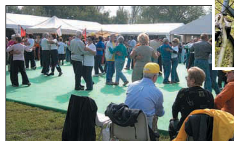
Il ballo liscio

ti in zona. E poi una piazza col palco che ha ospitato interventi musicali e teatrali. Sicuramente i più contenti sono stati gli utenti dei centri anziani di Milano che in 1500 hanno partecipato ad una camminata nel parco, seguita da un pranzo al sacco e dall'immane ballo liscio, a cui non rinuncerebbero mai. Anche noi di QUATTRO eravamo presenti ed avevamo esposto nel nostro stand i coloratissimi poster di Grand Hotel. Se la festa verrà rifatta l'anno prossimo, forse occorrerà valutare di farla in un parco di zona più accessibile, anticipando magari anche la data.