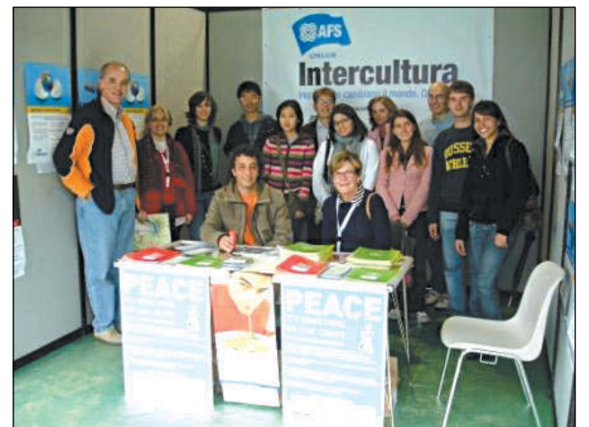
30/9 - lo stand di Intercultura alla Festa del Parco Forlanini

"Penso sia difficile condensare in poche righe un'esperienza di due mesi dall'altra parte del mondo, in Nuova Zelanda. Il programma bimestrale è uno dei più brevi organizzati da Intercultura, ma forse anche uno dei più intensi - catapultati in un altro stato, in un'altra famiglia, in un'altra scuola, sembra di dover ripartire appena arrivati. Più che la nostalgia però rimane la consapevolezza di aver vissuto un'esperienza irripetibile e indimenticabile, di cui certo non ricorderò tanto la visita delle bellezze naturali (per quanto incredibili) ma le discussioni a cena con la famiglia ospitante, gli intervalli passati con i compagni di classe neozelandesi, il ballo della scuola, le lezioni di coro, la visita del primo ministro, i muffin squisiti della madre ospitante, le grandi spese al supermercato del week end... e l'impressione di aver vissuto, per un attimo, un'altra vita di cui però, anche tornati, ci rimane qualcosa dentro."