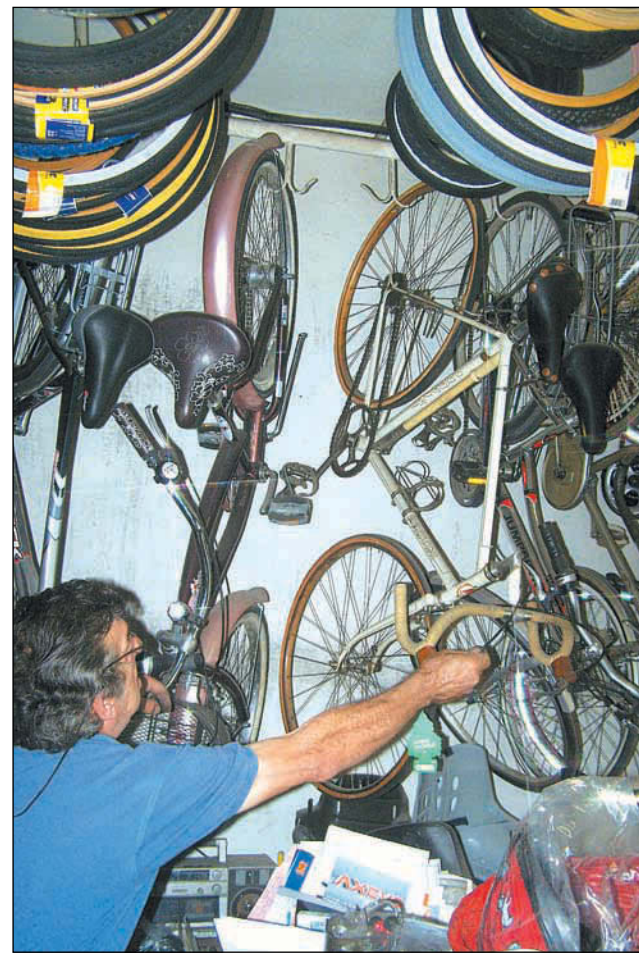
La bicicletta da corsa Provini con i cerchi in legno