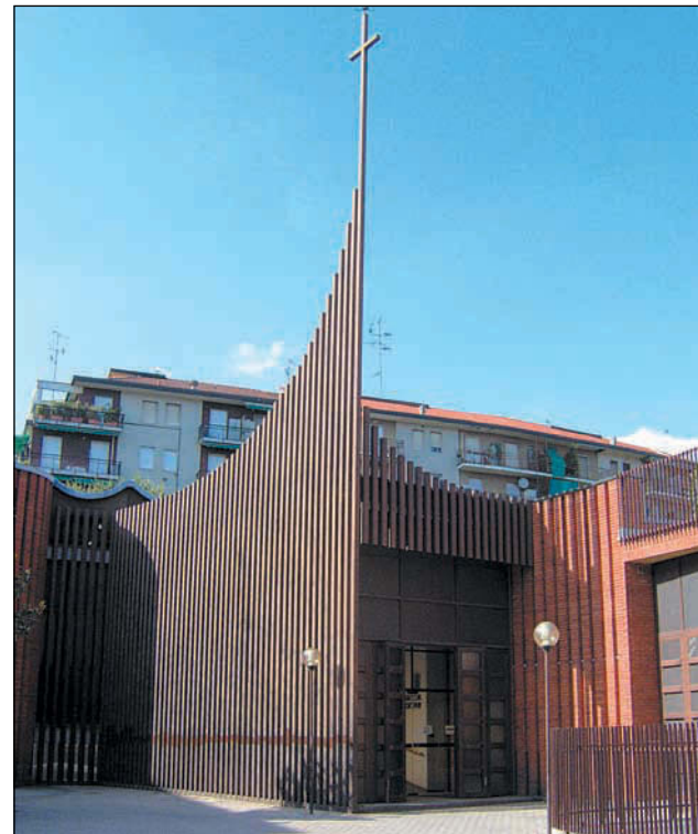
La Chiesa di Ognissanti

A un centinaio di metri si trova piazza Angilberto II; lasciandoci a destra un'altra trattoria toscana che ha mantenuto un'ambientazione anni '50 al suo interno, ed un palazzo al civico 42 caratterizzato da una lunghissima balconata al primo piano, raggiungiamo quindi questo snodo dalla forma geometrica complessa, ottenuto anche sventrando una parte della casa di ringhiera prospiciente da via Bessarione e Romilli (come tuttora evidentemente visibile). Questo ci conferma che, se pure dopo la piazza la strada prende il nome che terrà fino al con-